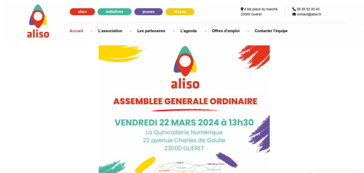
Capture écran site internet 16.02.2024 www.aliso.fr